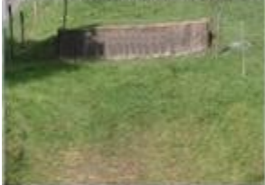
4 Wall ab