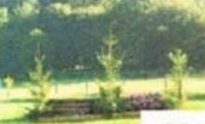
11 Wall auf