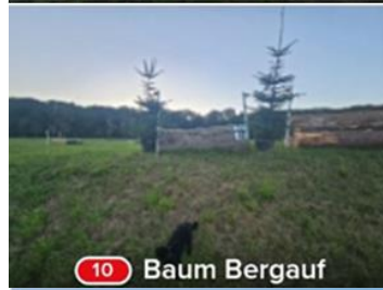
10 Baum Bergauf