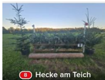
8 Hecke am Teich